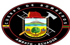
logo.jpg 29 KB