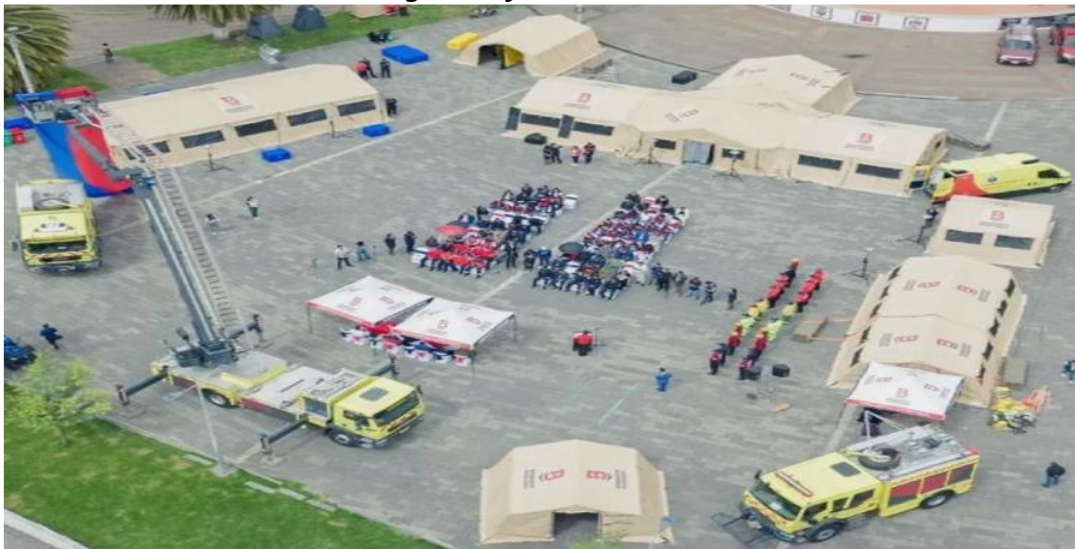
Figura Referencial N.º 2