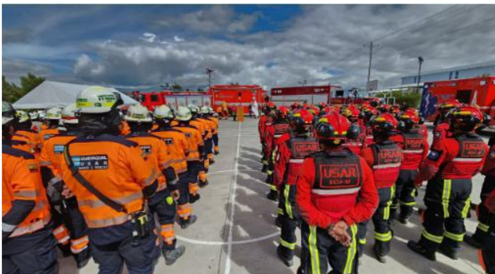
Figura N. º 1