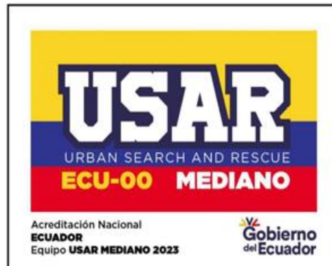
Ilustración 3: Parche de reconocimiento para equipos USAR Medianos

Elaborado por: Secretaría de Gestión de Riesgos, septiembre 2023.